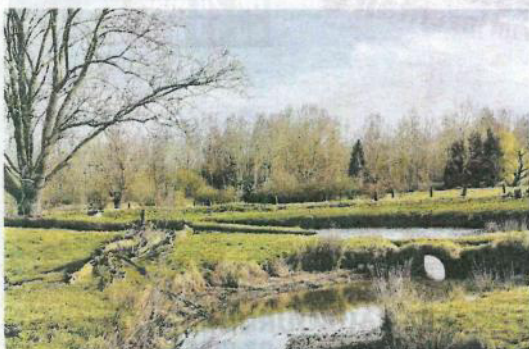
Hormis le plan d'eau principal, il en existe d'autres, dont des bras morts qui font l'agrément des promeneurs.

Il y existe plusieurs plans d'eau sur le site, alimentés par deux sources : l'étang principal, puis un bras mort doté d'une passerelle, ensuite un autre étang avec un îlot central, et, enfin, un autre bras mort qui revient vers l'entrée du site. Il s'agit de l'ancien parcours à truites pour lequel les pêcheurs payaient un forfait. Un autre permettait de pêcher à la pièce. Il sert aujourd'hui de réserve piscicole lors du rempoissonnement. ■