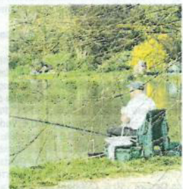
Très vite, près de 4 000 pêcheurs ont fréquenté le site à l'année.